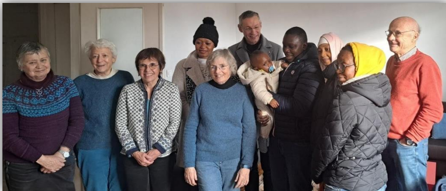
Accueil des nouveaux habitants par les bénévoles et le maire de Meylan en janvier 2026

Vous avez eu l'info. Pour rappel du contexte, 150 personnes migrantes sans solution d'hébergement se sont installées dans le hall de la Métropole à Grenoble depuis la mi-novembre 2025. Le président de Grenoble Alpes Métropole a sollicité les 49 communes pour qu'elles prennent part au relogement de ces personnes, parmi lesquelles de nombreuses femmes et enfants.